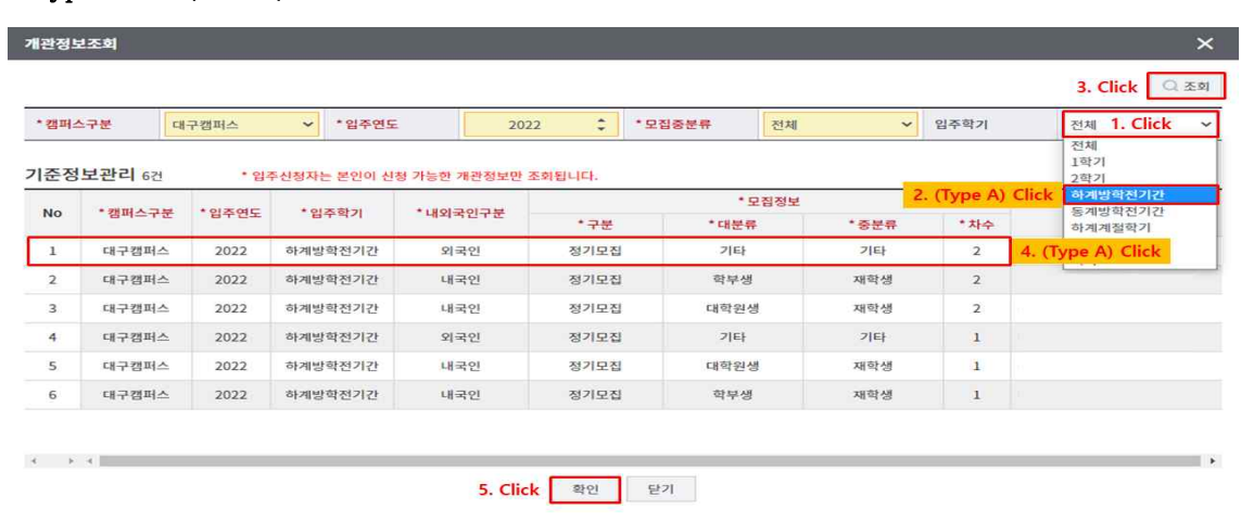
<Type B>: 6/22~7/16