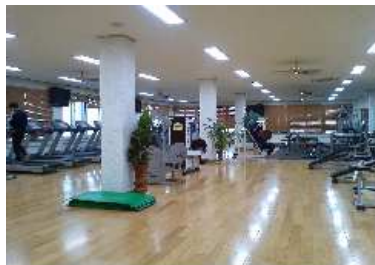
[ 헬 스 실 ]