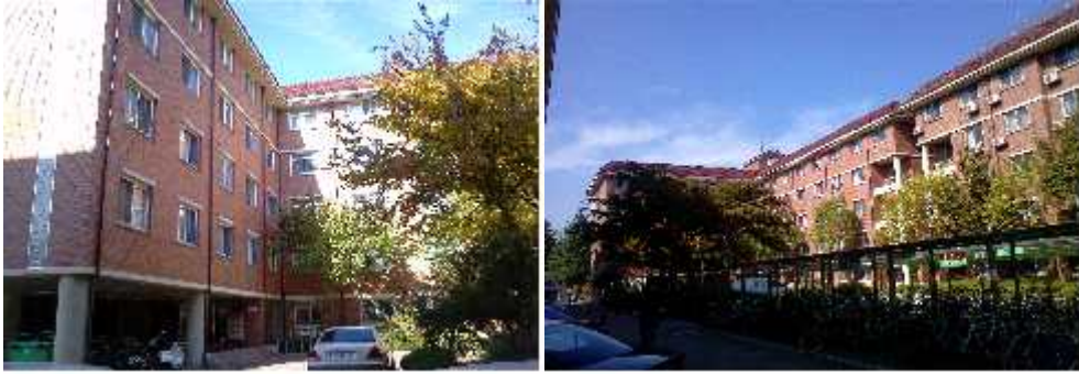
[ 진 리 관 ]