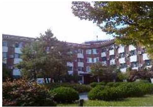
[ 성 실 관 ]