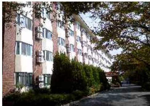
[ 금 지 관 ]

2. 2021학년도 1학기 관별 모집인원: 학부, 대학원 남학생 284명(2인실 운영, 별도 모집)