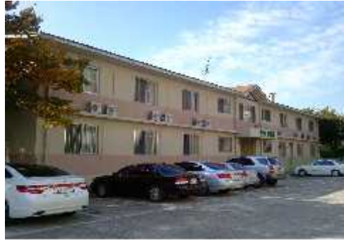
[ 면 학 관 ]