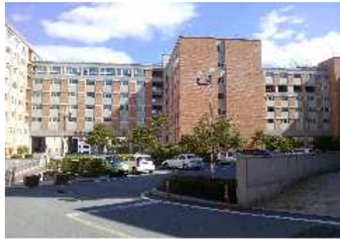
[ 첨성관 ]

2. 2021학년도 관별 모집인원: 학부, 대학원, 외국인 남·여학생 1,362명(남 730명, 여 632명)