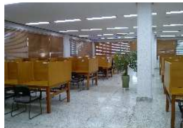
[ 독 서 실 ]