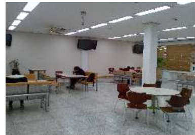
[ 휴 게 실 ]