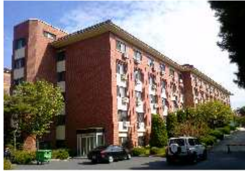
[ 협 동 관 ]

2. 2021학년도 1학기 관별 모집인원: 학부, 대학원 여학생 214명(2인실 운영, 별도 모집)