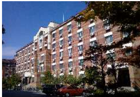
[ 화 목 관 ]