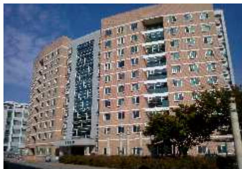
[ 향 토 관 ]

3. 2021학년도 지자체 선발 학생은 600명이며 나머지 잔여석의 경우 재학생으로 선발한다.