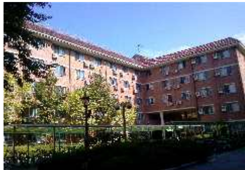
[ 봉 사 관 ]

2. 2021학년도 관별 모집인원: 학부, 대학원 여학생 191명(2인실 운영)