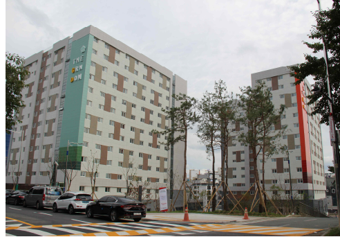
[ 누 리 관 ]

2. 2021학년도 관별 모집인원: 학부, 대학원 남·여학생 1,194명(남 596명, 여 598명)