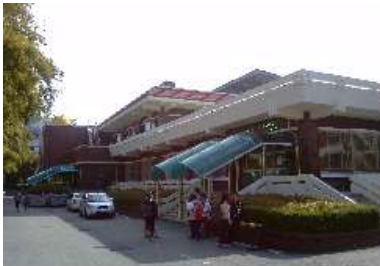
[ 문화관 입구 ]

1985.9.24. 개관한 이후로 1층에는 455석의 식당이 있고, 2층에는 헬스실, 독서실, 휴게실, 어학연습실 등의 문화공간이 있다. 문화관을 마주보고 오른쪽으로 성실관이 있고 뒤쪽으로는 금지관 앞으로는 교수아파트가 있다. 2021학년도 폐관 예정