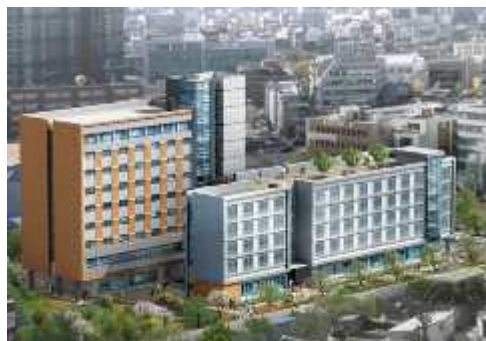
[ 명의관 ]

2. 2021학년도 관별 모집인원: 학부, 대학원, 외국인 남·여학생 332명(남 194명, 여 138명)