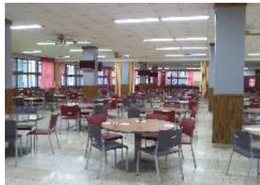
[ 식당 내부 ]