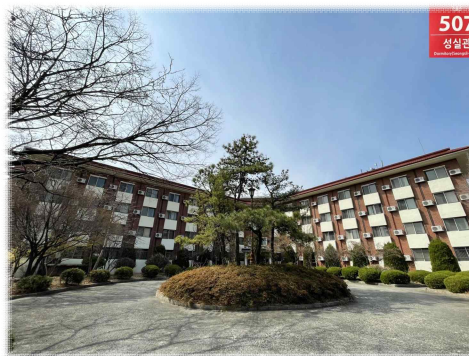
[ 성 실 관 ]