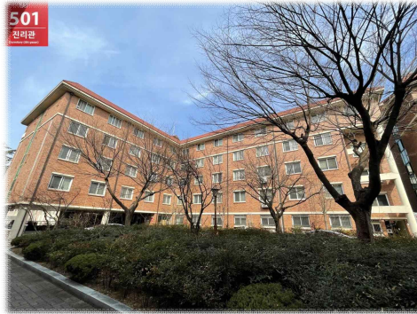
[ 진 리 관 ]