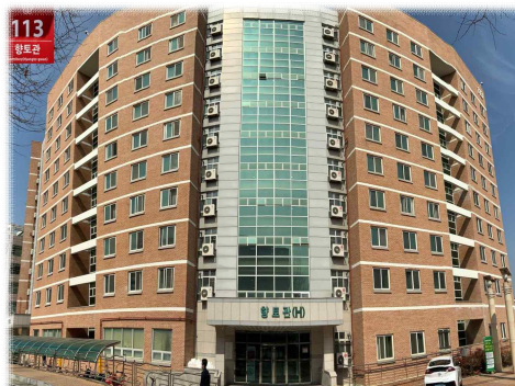
[ 향 토 관 ]