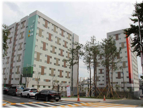
[ 누 리 관 ]