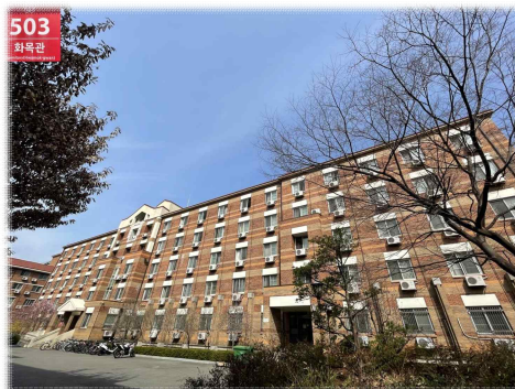
[ 화 목 관 ]