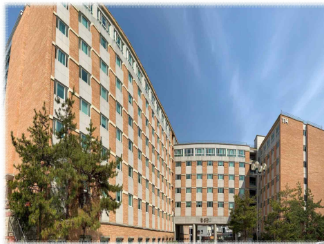
[ 첨 성 관 ]