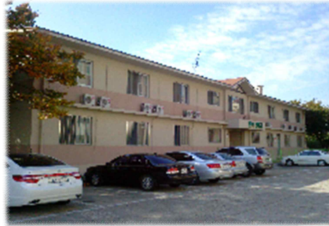
[ 면 학 관 ]