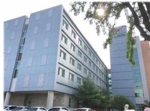
[ 명 의 관 ]