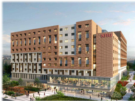
[ 보람관 ]