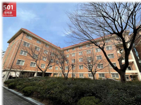
[ 진 리 관 ]