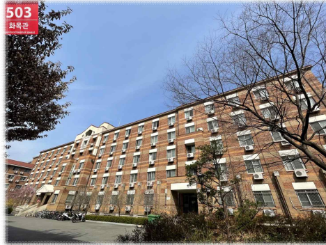
[ 화 목 관 ]