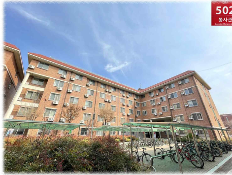
[ 봉 사 관 ]