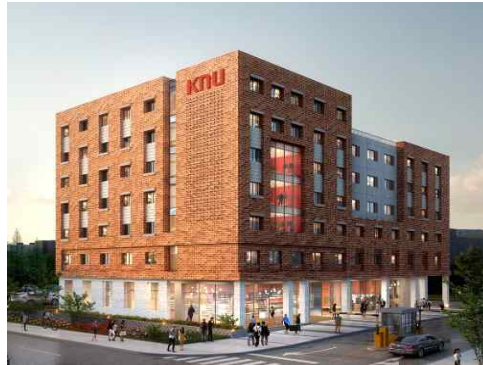
[ 선 의 관 ]